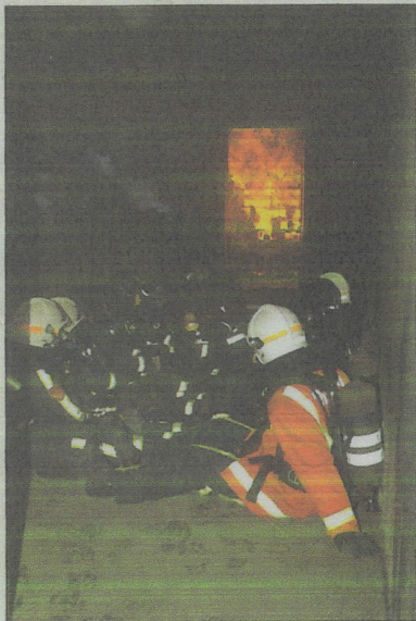
De ploeg is klaar voor de warmteoefening

Alle deelnemers dienden, voor de container werd betreden, de theorie gevolgd te hebben. Voor het beroeps personeel werd dit vooraf-